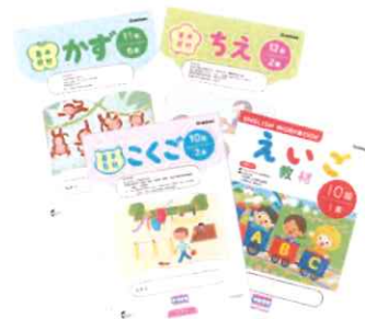
学研オリジナル教材